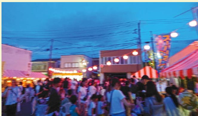
今年も好評だった模擬店の様子（8月6日、Mado-kaにて）