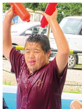
顔にかかると、へちや〜