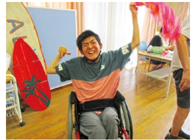
夏祭りはおみんなでアロハー!!楽しくハワイアン!