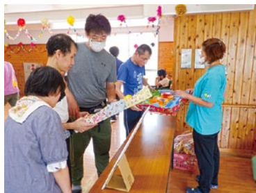
ボールヨロヨロに夢中です!