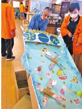
マリアデー サービス