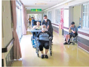
皆で避難訓練です!