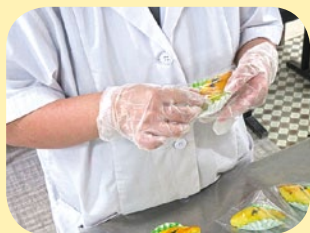
丁寧に作っています