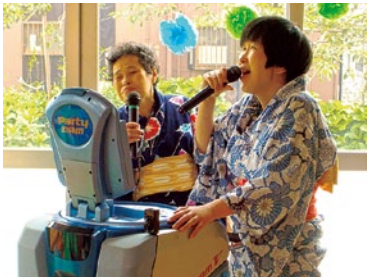
カラオケで大熱唱!