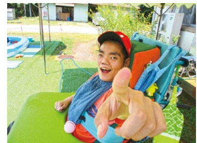
今年の夏も最高だぜ