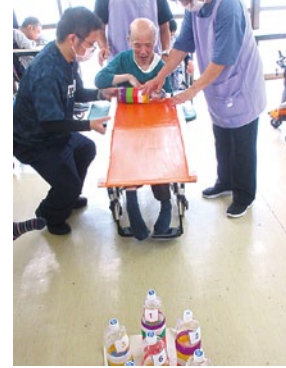
♪レクリエーション大会 モリッコ 全部倒すぞ～(▽▽)