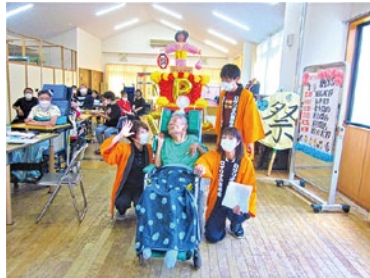
手作りの山車でお祭り気分♪