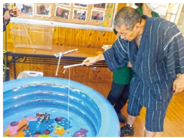
魚釣り目指せ大漁!