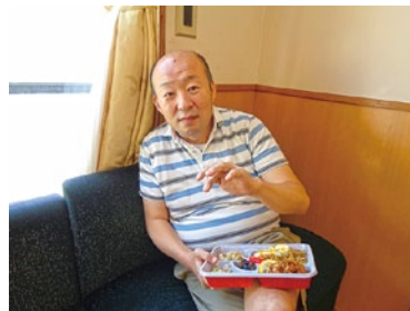
納涼祭仕様の盛沢山な昼食♪