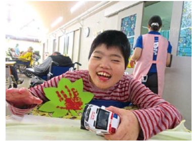
お楽しみ会 ～手形を取りました～