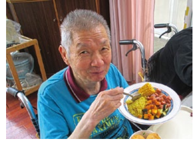
お血いっばいの さちぞう☆