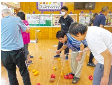
ラレーツ釣りまくり☆