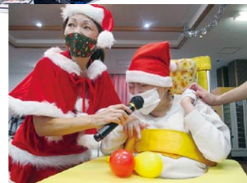
クリスマス食事会で♥熱唱♥