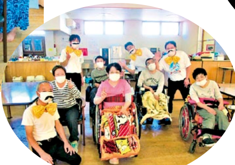
お楽しみ会にて レッツ!ひびダンス!!