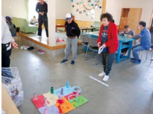
レクで輪投げに挑戦!(°◇°)♪