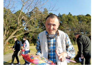
ミニゲームの景品ゲット!