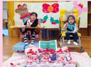
お菓子とオーナメントをいただきました