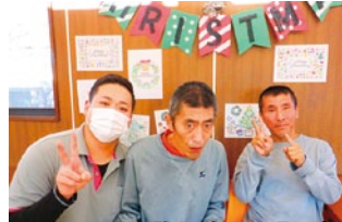
クリスマスの飾り付け完成!