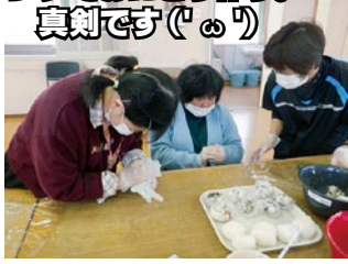
レクでおにぎり作り。 真剣です(°ω°)