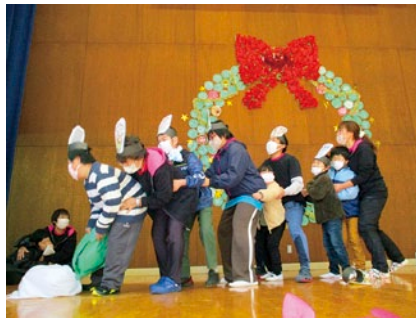
うんとぞしよ! ぞいしよ!!