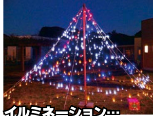
イルミネーション 今年も中庭に巨大ツリー★