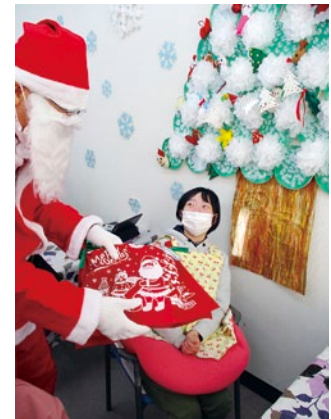
サンタさんが来た(°^°)♪