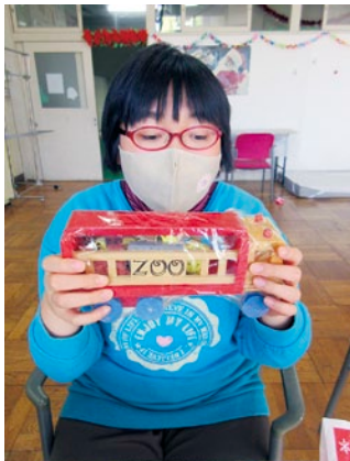
クリスマスプレゼントもらったよ♪