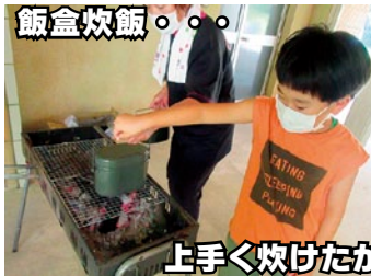
上手く炊けたかな?!