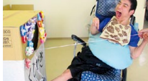
くじ引き! 何が当たるかな?~