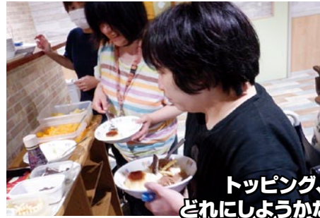
トッピング、どれにしようかな~?