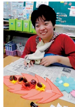
高秋の栗に顔を描いたよ(๑^ー^๑)