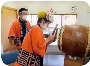
今年の夏祭りはねぶた祭を楽しもう!