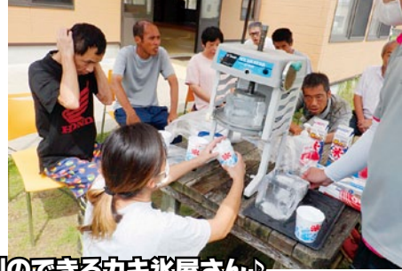
行列のできるカキ氷屋さん♪