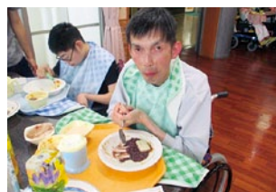
たくさん遊んだ後は 美味しいご飯で満腹です♪