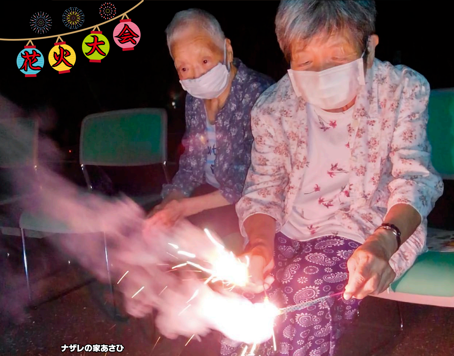
ナザレの家あさひ