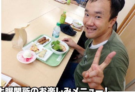
主曜開所のお楽しみメニュー!