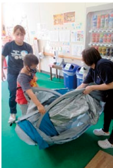
テントを張って避難所暮らし体験だ