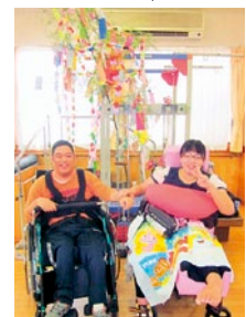
短冊に願いを込めて...