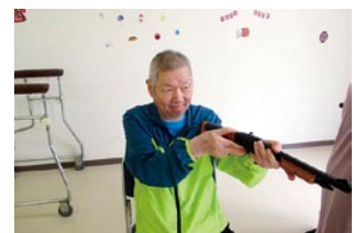
射的だよ~狙って 豪華賞品ゲット☆