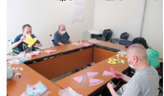
飾りは皆で 協力して作りました♡