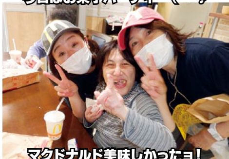
マクドナルド美味しかったヨ!