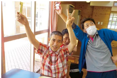
今日はお菓子パーティー(^^)