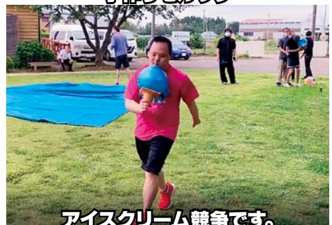
アイスクリーム競争です。