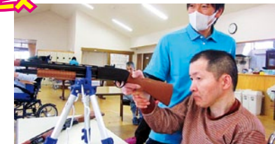
狙いを定めて。。。撃て——!!